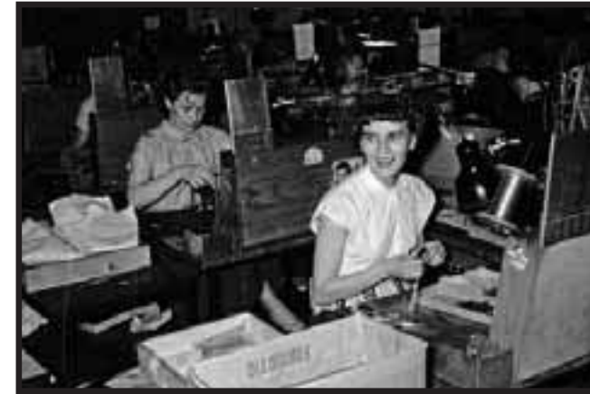
Fra produktionsafdelingen i 50'erne, da den lå på Ved Amagerbanen 23.

Men selv da direktionen nærmest truede de ansatte til at stemme Ja til EF i 72, så tilgav man også dét, fordi sammenhold, arbejdsglæde og det sociale liv fungerede så fint. Vi følte os på mange måder ét med vores arbejdsplads, selvom der kunne ryge en finke af panden, når snakken for eksempel nærmede sig de individuelle tystys-lønninger. Tillidsmandssystemet og funktionærforeningen, idrætsklubben mange sportsgrene, kunstforeningen, firma-julegaverne og sommerfesterne, kollegaer blev gift og venskabert født i arbejdstiden og taget med hjem i privatlivet. Det var altsammen med til, at Storno nåede op på cirka 2.500 ansatte i 1980 - heraf 1.000 i Danmark - og opnåede at blive Europas fjerdestørste producent af radioudstyr. Omkring 80 lande blev radioanlæggene eksporteret til i 1975.