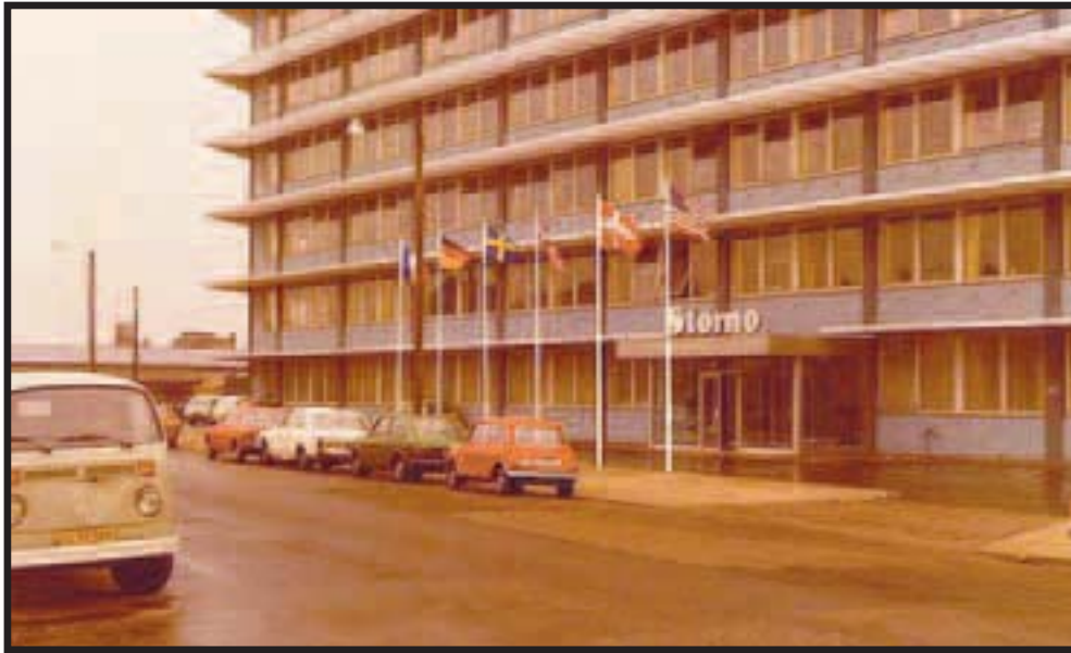
Storno på Artillerivej 126 engang i 70'erne.